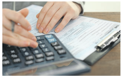
Die Steuer- und Abgabenbelastung ist in der Schweiz im Vergleich zu anderen Ländern geradezu gering.

BERLIN In der Schweiz wird die Arbeit nach wie vor deutlich weniger stark mit Steuern und Abgaben belastet als in den meisten anderen Industriestaaten. Dies geht aus der Studie «Taxing Wages 2017» der Organisation für wirtschaftliche Zusammenarbeit und Entwicklung (OECD) hervor. Liechtenstein wird darin nicht geführt. 2017 betrug die Belastung eines alleinstehenden Durchschnittsverdieners in der Schweiz durch Steuern und Abgaben 21,8 Prozent der Gesamtarbeitskosten für den Arbeitgeber. Nur gerade drei der 35 OECD-Länder kennen laut der am Donnerstag veröffentlichten Studie einen tieferen Wert als die Schweiz, nämlich Chile (7,0 Prozent), Neusee-